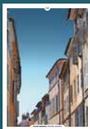
06 les débords de toiture