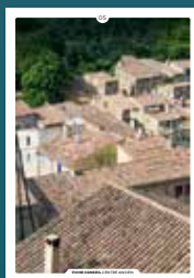
05 les toitures en tuiles rondes