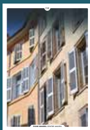
08 les volets