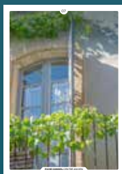
07 les fenêtres