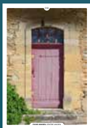
09 les portes