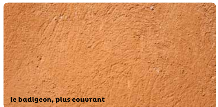
le badigeon, plus couvrant

Le fond de façade en enduit doit être vérifié par un examen attentif. Analysez les teintes de badigeons existantes avant restauration ou décroûtage. Consultez un professionnel (artisan-maçon ou architecte) pour le diagnostic, le suivi et la réalisation des travaux.