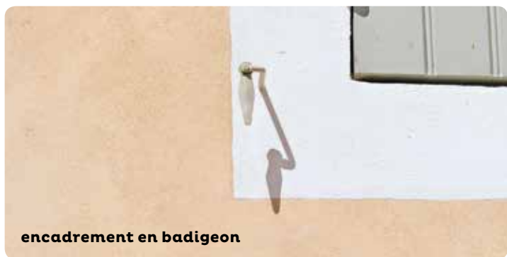
encadrement en badigeon

Sur un support ciment existant, prévoyez une peinture à liant minéral, plus compatible avec ce matériau.