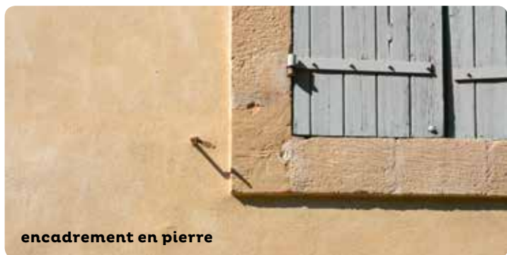
encadrement en pierre