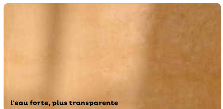
l'eau forte, plus transparente