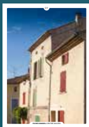
01 les façades enduites

Chaque intervention sur les façades de nos centres anciens compte et participe à l'harmonie du paysage urbain. Au cœur de nos villes et villages, l'intérêt particulier et l'intérêt général doivent être conjugués pour créer le cadre de vie que nous y recherchons tous.